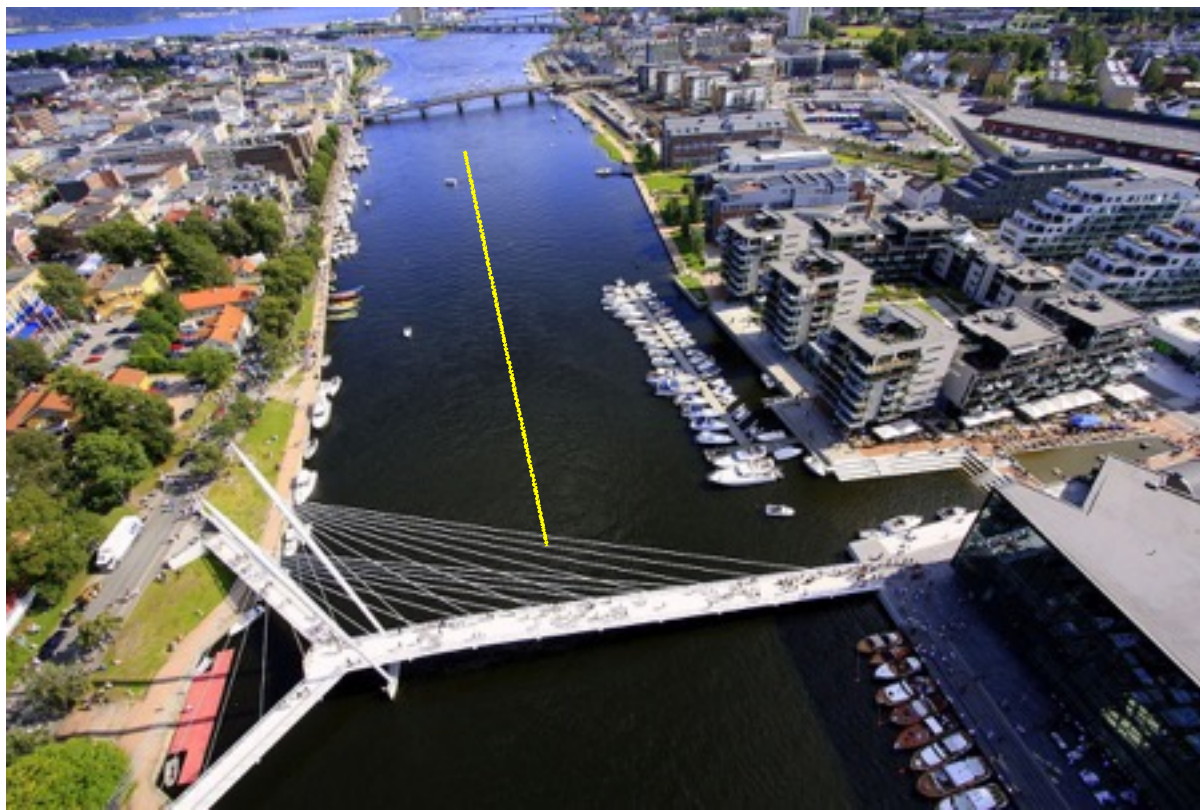
Området for duellen