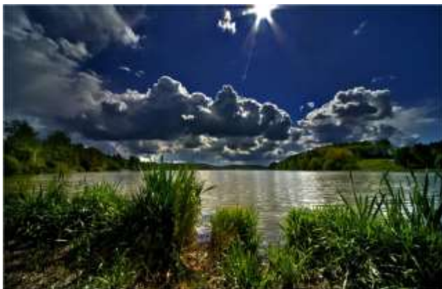
Årungen Ro- og Padlesenter